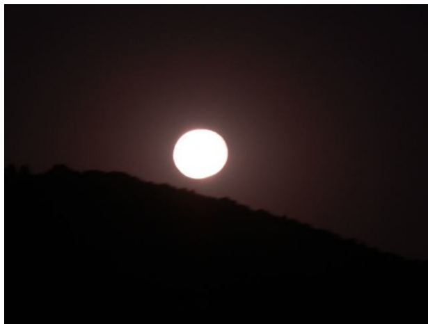
Pleine Lune 08/08

Le 16 août, ce fut une très belle Pleine Lune avec une éclipse de Lune complète et magnifique.