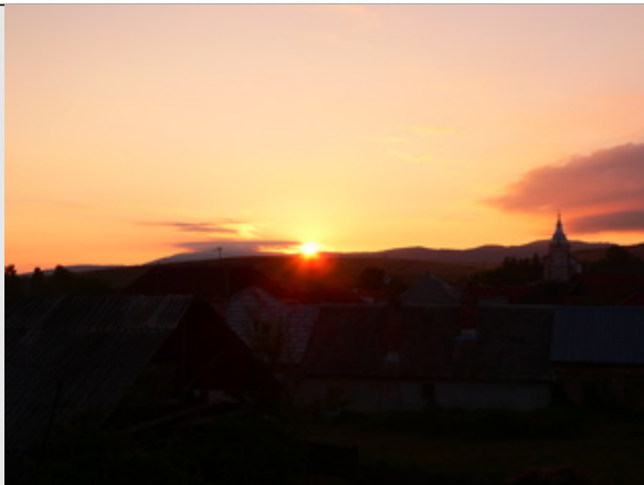
Lever de soleil sur P. 072007