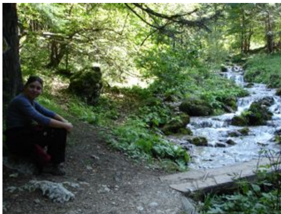
Randonnée en forêt1

Plus authentique, plus tranquille, moins loin, moins cher... Dépaysez-vous en toute simplicité, vivez l'accueil de la Transylvanie au quotidien de sa campagne, vous y recouvrirez des forces !