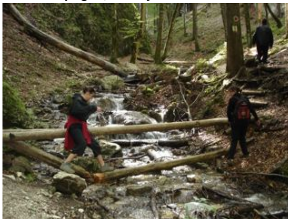
Randonnée en forêt

Plus authentique, plus tranquille, moins loin, moins cher... Dépaysez-vous en toute simplicité, vivez l'accueil de la Transylvanie au quotidien de sa campagne, vous y recouvrirez des forces !