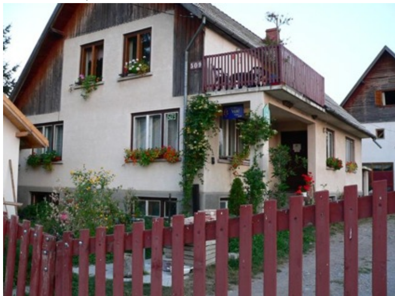
Le 509 chez les MATYAS, tout fleuri

Enfin le 509 croulait sous les fleurs capucines, lauriers et chèvrefeuille.