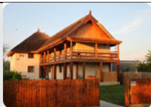
Une des maisons

L'Arbre de Joie est ainsi obligé de se laisser bercer avec joie et reconnaissance au fil du hasard et des projets aléatoires germant dans les cerveaux ébouriffés de quelques bandes de jeunes français ou autres... - Au passage, ils sont de toutes provenances sociales et géographiques et bien sûr, créatifs, imaginatifs, volontaires, vivants, en toute conscience... Nous, nous l'avons toujours su, mais il paraît que cela va mieux en le disant... ;o) -