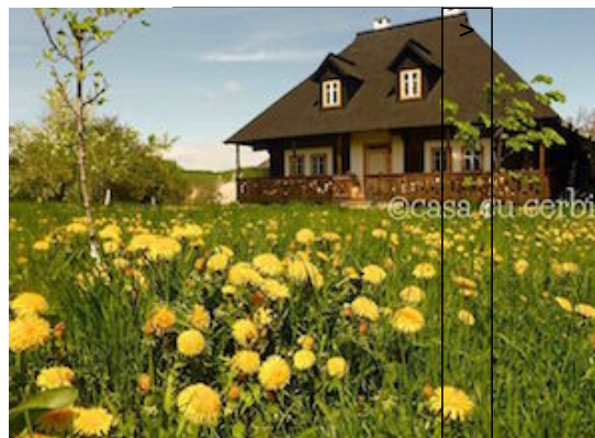
Casa cu Cerbi

La célèbre Casa Cu Cerbi est un lieu de rencontres bucolique, aux chambres d'hôtes tout confort, à la cuisine délicieuse, avec un chaleureux accueil garanti.