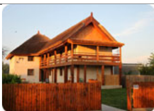
Une des maisons