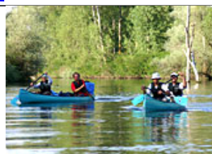
En kayak aussi

A Tulcea, vers 13h30, il faut prendre un bateau de la NAVROM pour Cri_an à côté de l'hôtel Esplanada , (téléphoner à Petre pour avoir confirmation de l'horaire). Si vous devez dormir à Tulcea, il y a deux pensions pas loin : Pension Insula et Pension Delta Dunari à côté de l'administration de la Réserve. (entre 100 et 150 lei/par pers. sans petit déjeuner !)