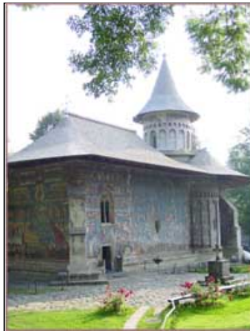
Monastère de Voronet